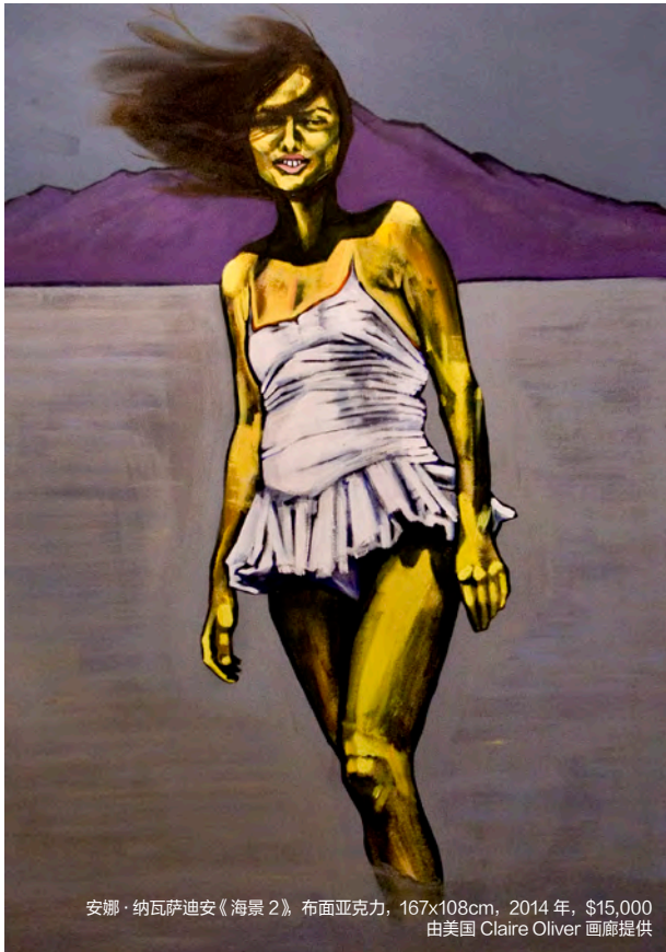
安娜·纳瓦萨迪安《海景 2》, 布面亚克力, 167x108cm, 2014年, $15,000